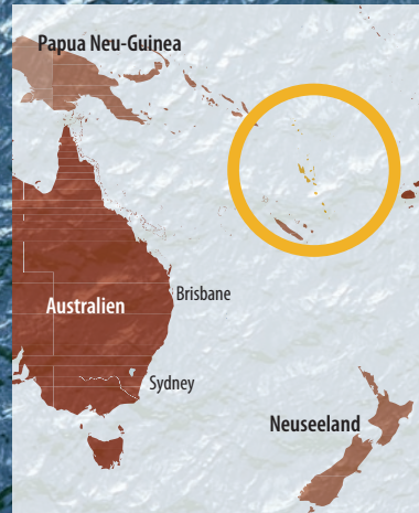
Routenplan*: Port Vila (Vanuatu) – Epi – Espiritu Santo – Torres Isl. – Lata auf Ndeni (Solomon Isl.) – Vanikolo – Tikopia – Anuta – Port Vila * Kann wetterbedingt geändert werden.