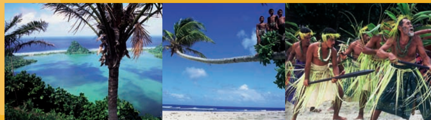
Impressionen der Santa-Cruz-Inseln