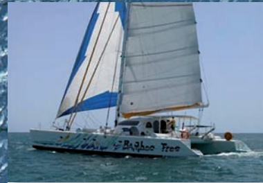
„Bamboo Free“ - ein schneller, komfortabler Hochsee-Katamaran