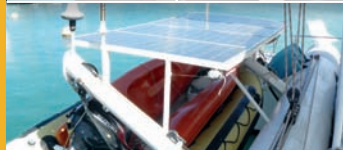
Ansichten des Bootes