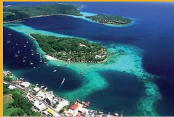
Ansicht von Port Vila

Mein spannender Öku-Thriller, der u. a. in den Santa-Cruz-Inseln handelt, ist vergriffen, aber über amazon.de oder ebay.de antiquarisch zu beziehen.