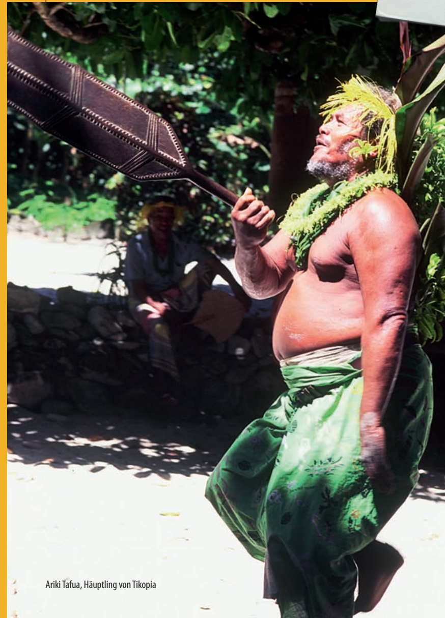
Ariki Tafua, Häuptling von Tikopia

Klaus Hympendahl – Weltumsegler, Bucherautor, Leiter der Südsee-Expedition „Lapita-Voyage“. Hierüber hält er Vorträge. Der Film erscheint im ZDF unter „Terra X“ im Juni 2010.